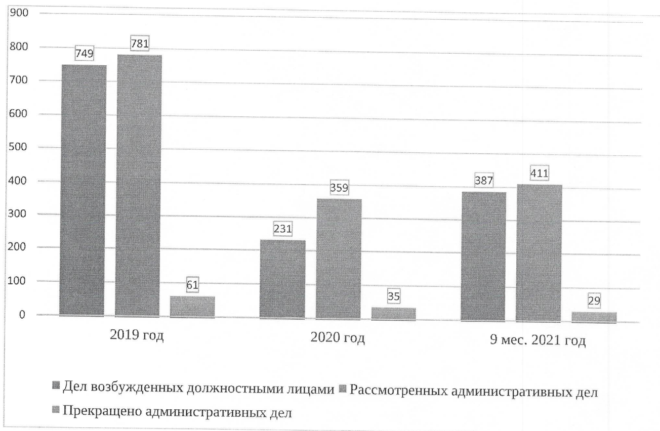
Количество рассмотренных дел об административных правонарушениях за 2019–9 мес. 2021 года

О зависимости количества выявленных нарушений от числа проведенных плановых и внеплановых проверок субъектов хозяйственной деятельности, оказывающих негативное воздействие на окружающую среду в Свердловской области.