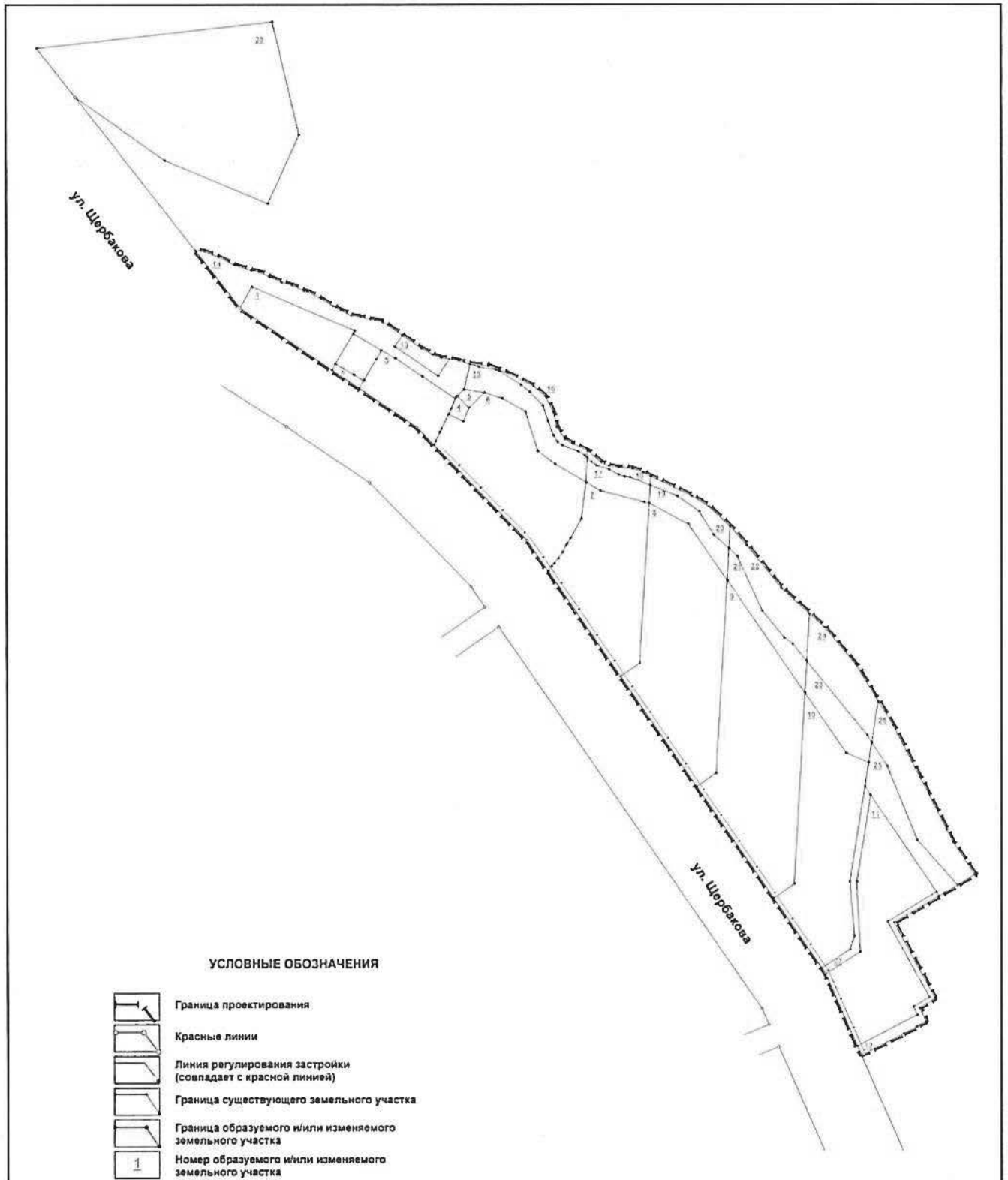
Схема межевания территории (на расчетный срок)