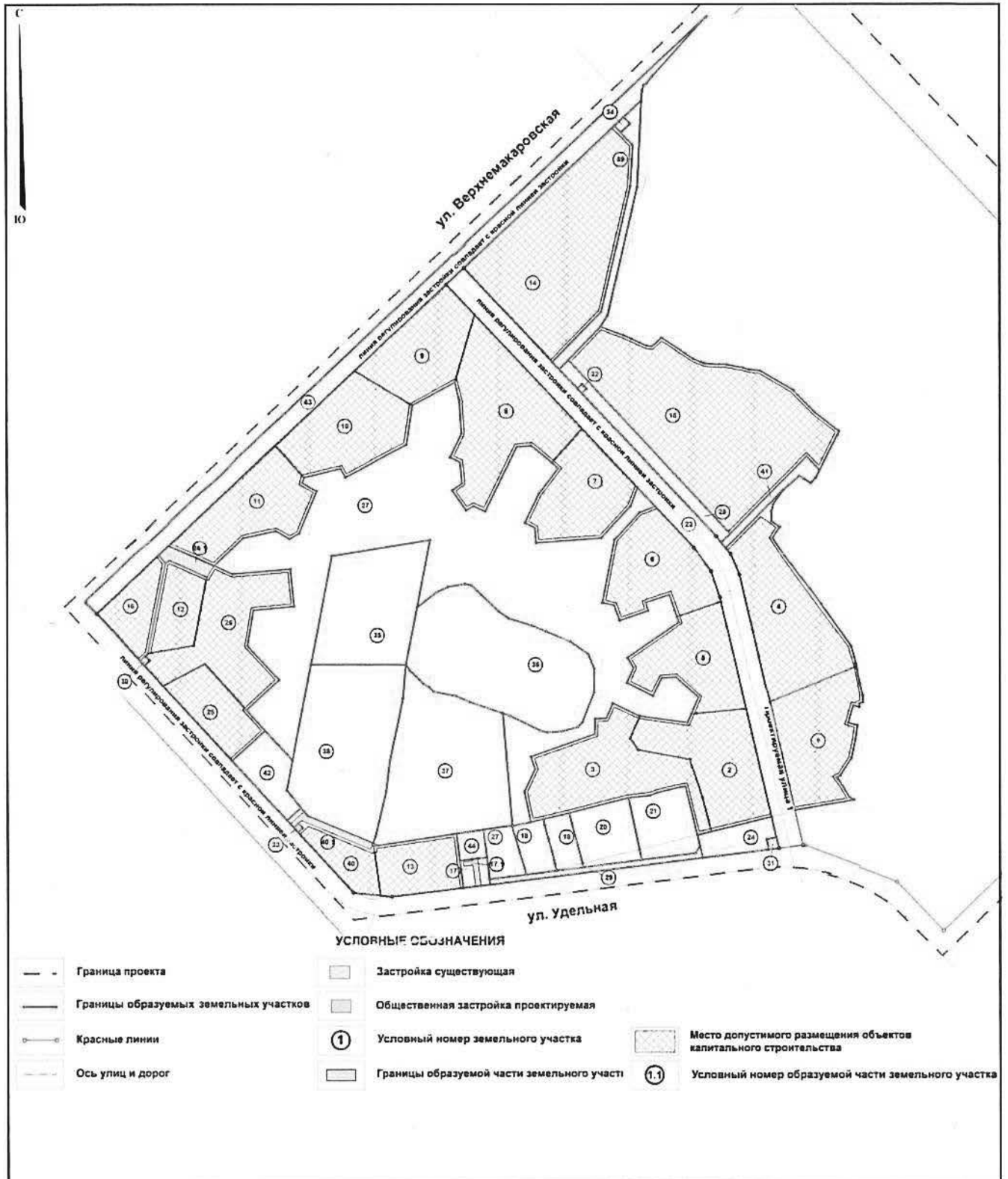
Схема межевания территории

Приложение № 3 к приказу Министерства строительства и развития инфраструктуры Свердловской области от 30.10. № 1114-17