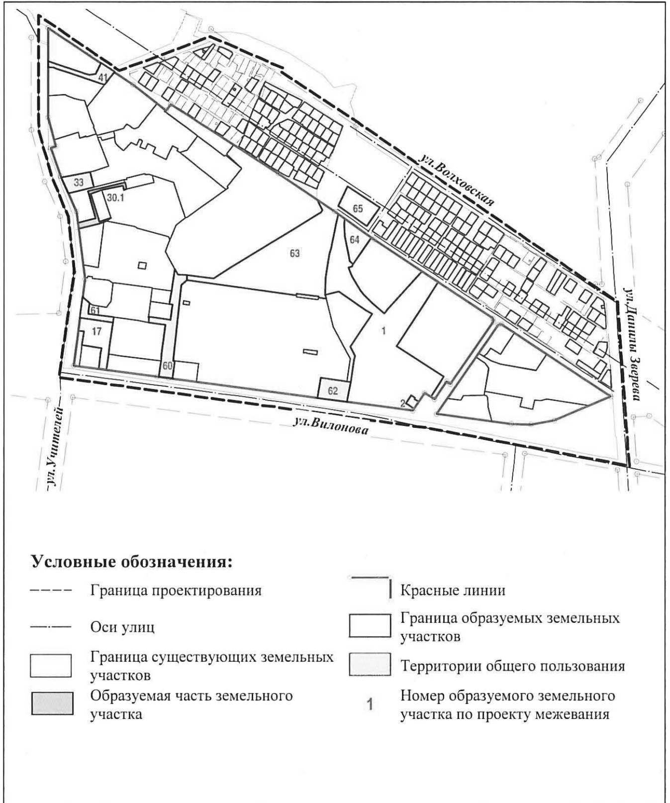
Схема межевания территории

Приложение № 3 к приказу Министерства строительства и развития инфраструктуры Свердловской области от 16.11.2018 № 1193-17