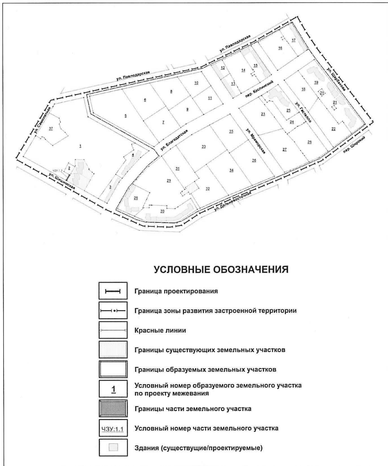
Схема межевания территории (2 этап)

Приложение № 3 к приказу Министерства строительства и развития инфраструктуры Свердловской области от 16.11.2014 № 1210-17