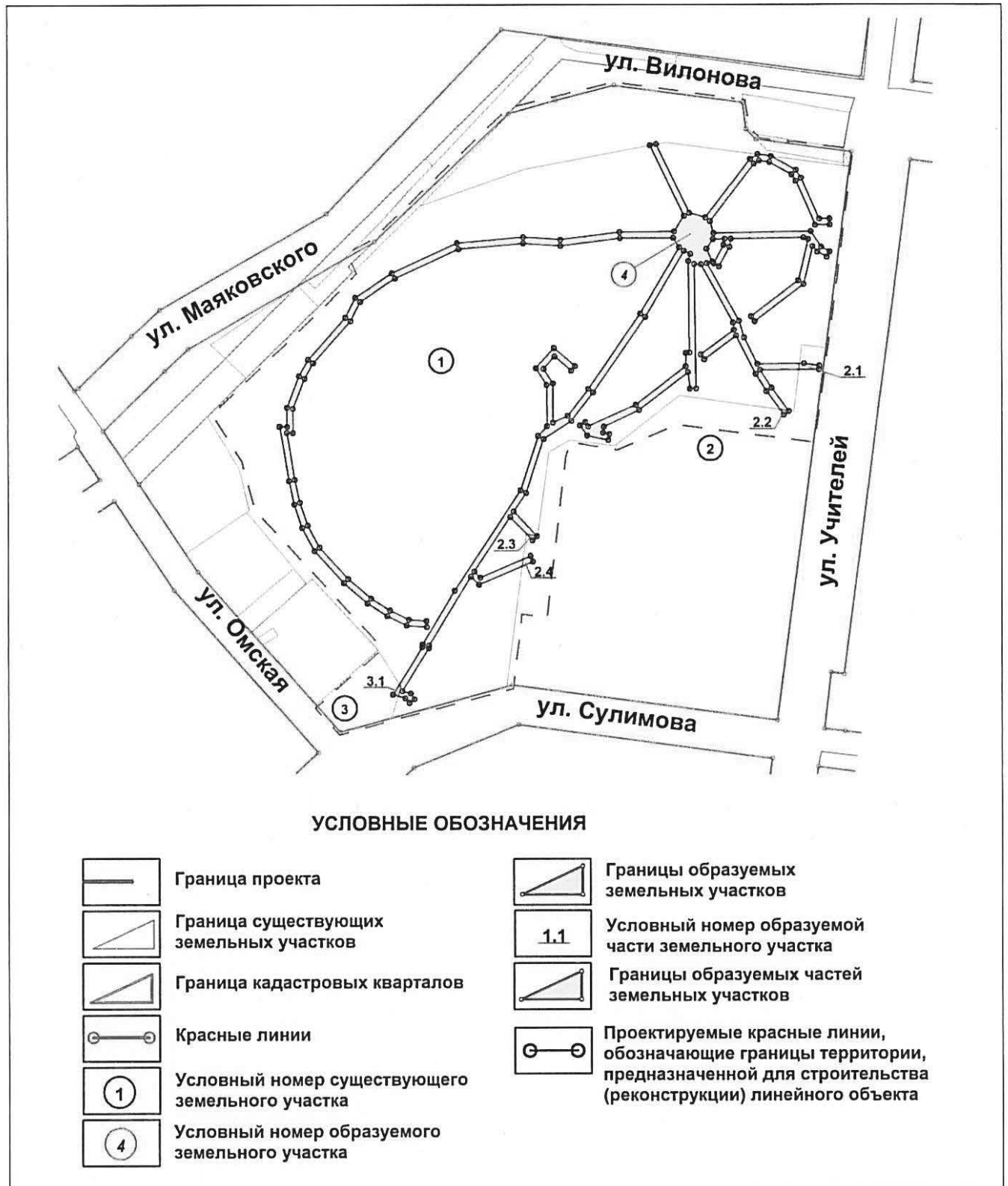
Схема межевания территории (на период строительства)

Приложение № 5 к приказу Министерства строительства и развития инфраструктуры Свердловской области от 15.12.2017г. № 1324-17