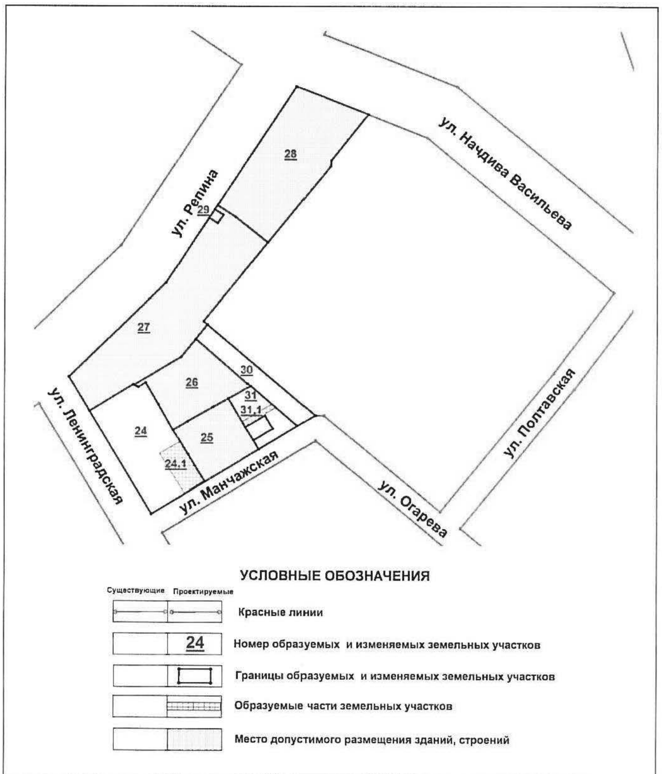
Схема межевания территории

риложение № 6 к приказу Министерства строительства и развития инфраструктуры Свердловской области от 28.04.2017г. № 482-17