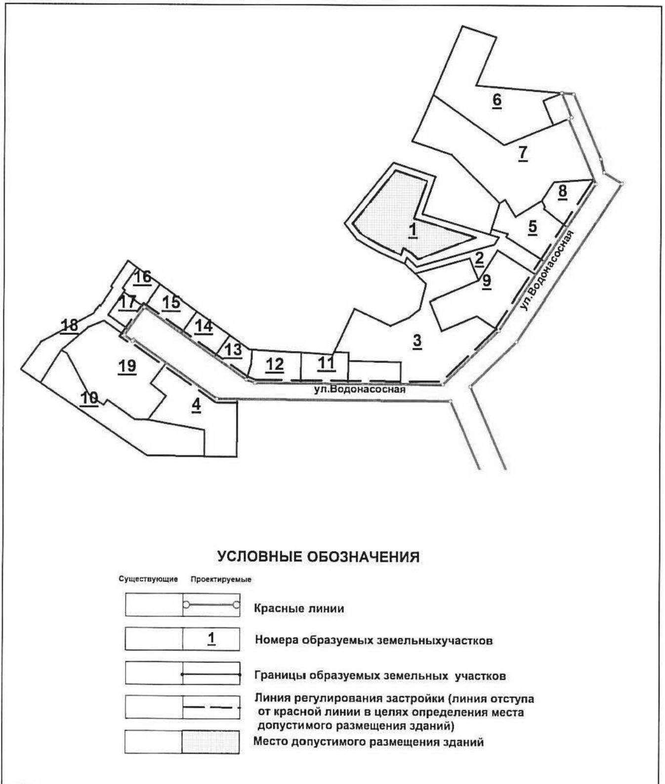
Схема межевания территории

Приложение № 1 к приказу Министерства строительства и развития инфраструктуры Свердловской области от 05.05.2018 , № 515-17