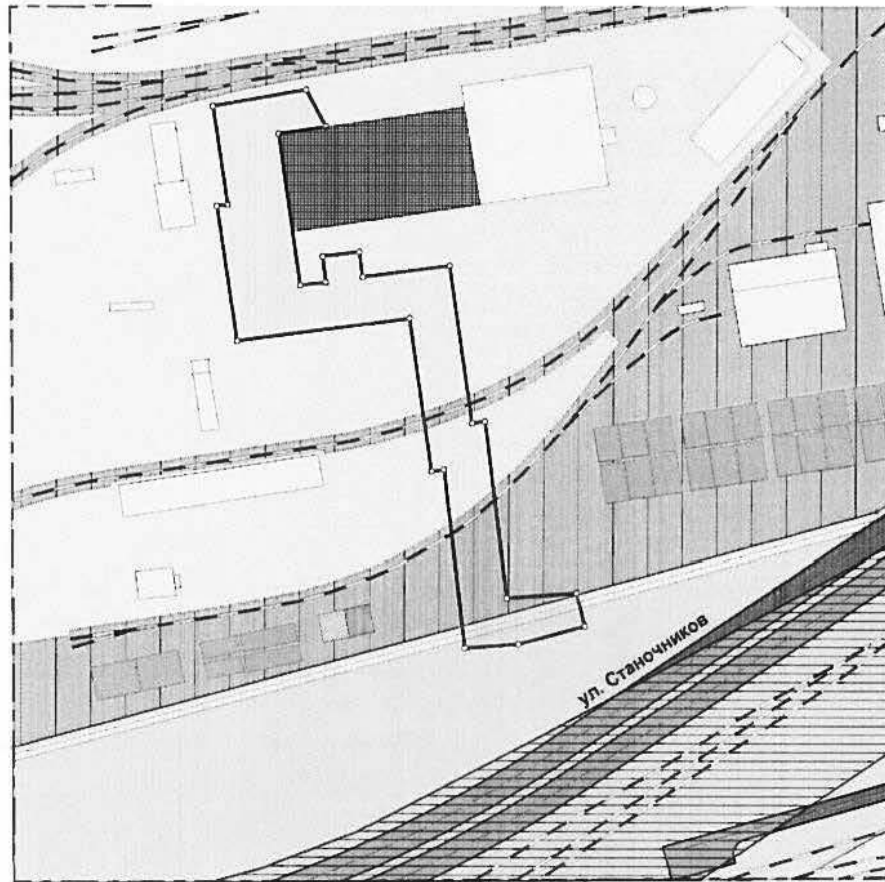
Схема планировки территории