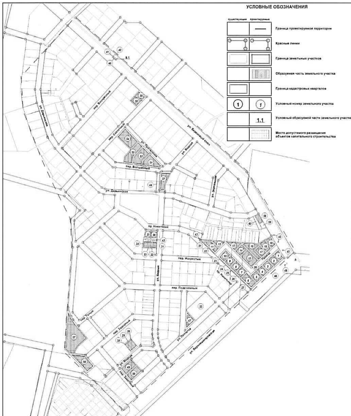
Схема межевания территории