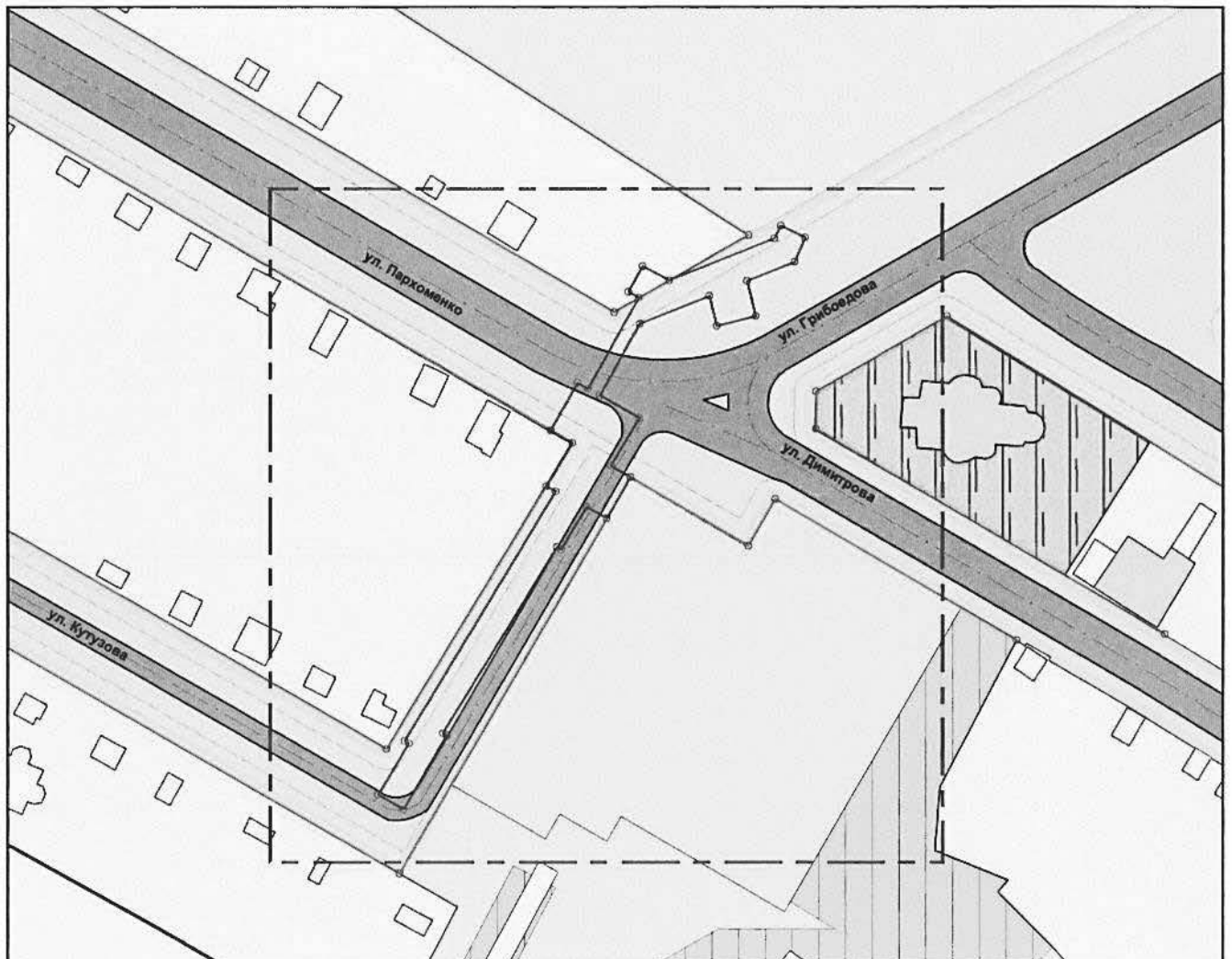
Схема планировки территории