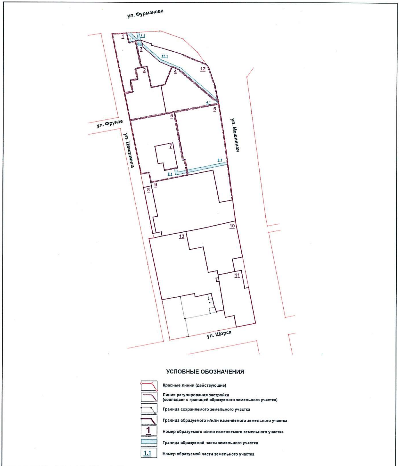
Схема межевания территории

Приложение № 6 к приказу Министерства строительства и развития инфраструктуры Свердловской области от 26.12.2017г № 1394-П